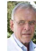
PD Alois Lang | Feldkirch