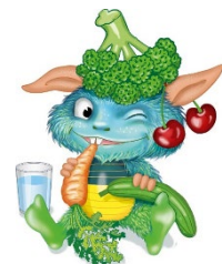
Das kleine Schmeck, Hörspiel